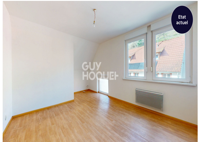
PROPOSITION D'AMENAGEMENT 3D - PHOTO NON CONTRACTUELLE