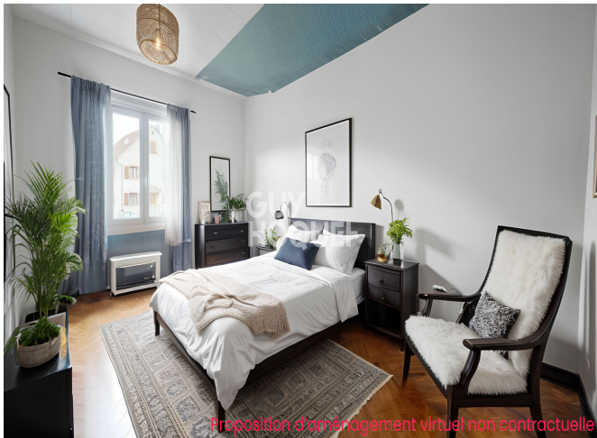
Proposition d'aménagement virtuel non contractuelle